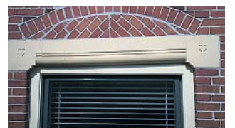
▲ Rondboogmetselwerk met daaronder lateien van natuursteen of stucwerk is typerend voor de ontwerpen van Nijhuis sinds 1903. Inclusief twee in elkaar geplaatste kubusvormen (een links en een rechts) met twee lijnen daartussen. De kubussen zijn mogelijk ingegeven door het gedachtegoed van de vrijmetselaren. Voor die tijd was er geen sprake van typische Nijhuis-signatuur, zeggen Peter Suidman en Herman Waterbolk. "Nijhuis legde een grote stilistische souplesse aan de dag door zich niet te beperken tot bepaalde vormen. Hij hanteerde diverse architectuurmoden waar de opdrachtgevers of de tijdgeest om vroegen en dat deed hij niet zonder daarin eigen genoeg te scheppen. Het lijkt hem ook gemakkelijk te zijn afgegaan."

► Het pand van het Nieuwsblad van het Noorden aan het Zuiderdiep in Groningen.